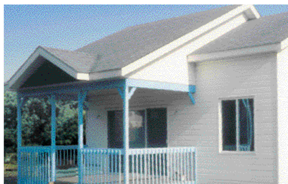
Bungalow met alle voorzieningen.